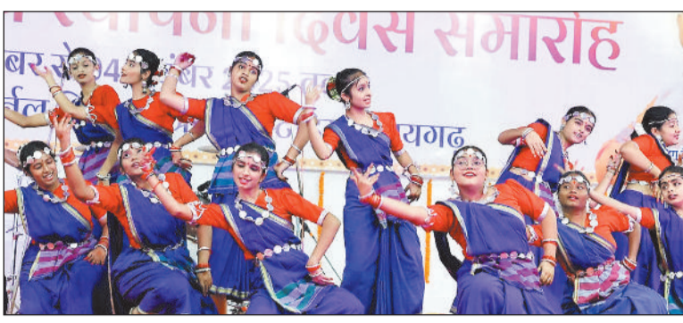
लोक कलाकारों और विद्यार्थियों की शानदार प्रस्तुतियों ने मोहा मन

छत्तीसगढ़ राज्य स्थापना दिवस के रजत जयंती वर्ष के उपलक्ष्य में रायगढ़ जिला मुख्यालय स्थित शहीद कर्नल विक्लव त्रिपाठी स्टेडियम में 2 से 4 नवंबर तक आयोजित तीन दिवसीय जिला स्तरीय राज्योत्सव 2025 का आज समापन हुआ। इस अवसर पर लोकसभा सांसद राधेश्याम राठिया मुख्य अतिथि के रूप में शामिल हुए। उन्होंने भारत माता और छत्तीसगढ़ महतारी के छायाचित्र के समक्ष दीप प्रज्वलित किया। उन्होंने विभिन्न विभागों के द्वारा लगाए गए प्रदर्शनी की सराहना की। उन्होंने कहा कि यहां लगाए गए स्टालों में प्रदर्शित स्वदेशी उत्पाद देश