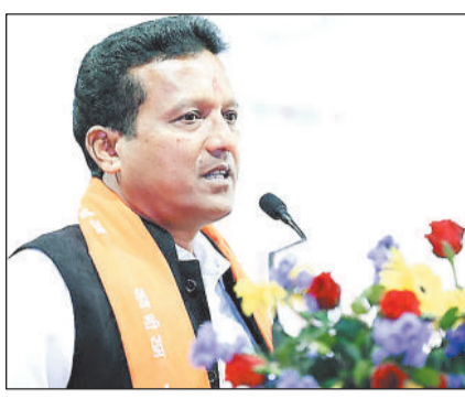
हरिभूमि न्यूज ►► रायगढ़